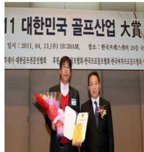
수상기업 CEO 사진