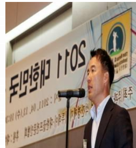
수상기업 수상소감 장면1