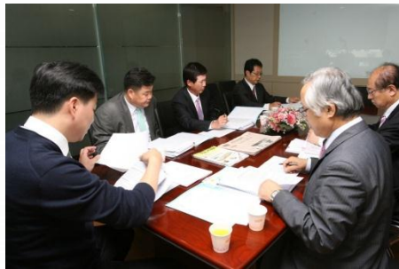
서류 심사 사진